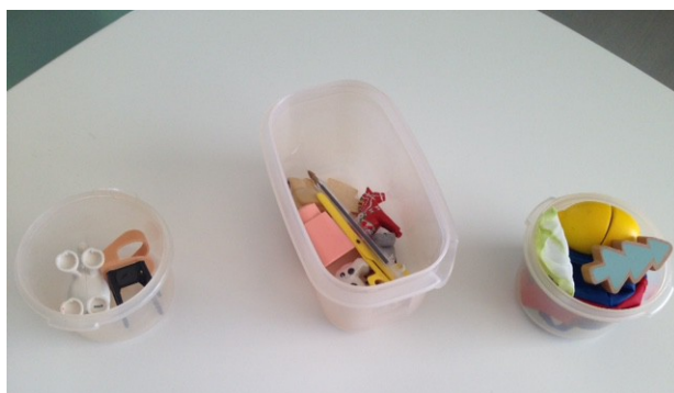
boîte des mots en « ch »